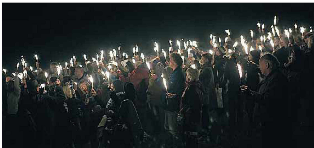
Een beeld uit 'Eclips': de 'reizigers' staan op de helling van het nieuwe natuurtheater.